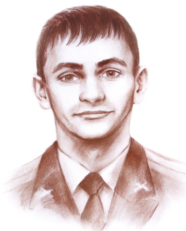
Герой России Александр Александрович Прохоренко