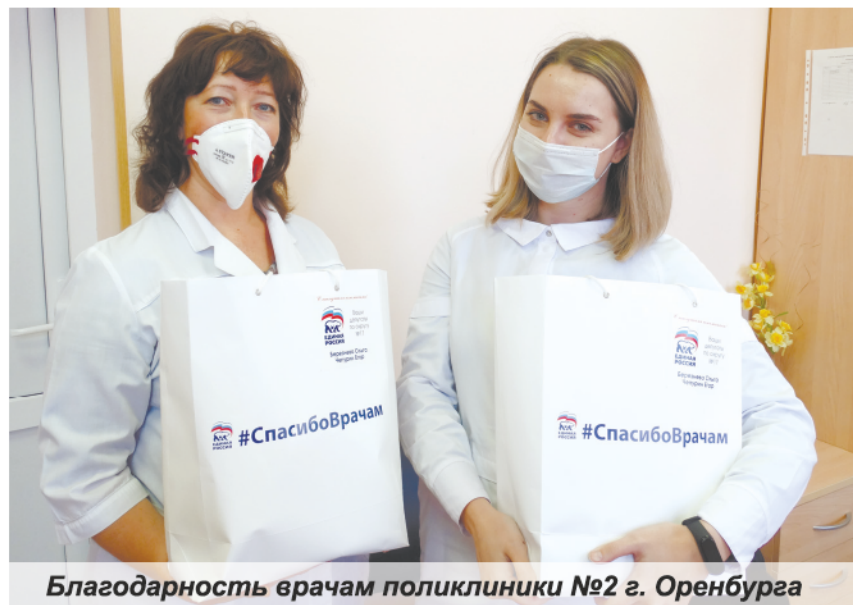
Благодарность врачам поликлиники №2 г. Оренбурга