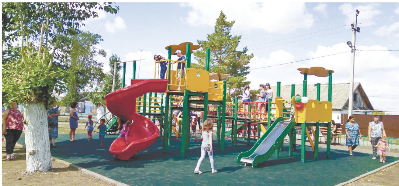
Результат «инициативного бюджетирования»: детская площадка в селе Кваркено

Следующий шаг — формирование предварительного бюджета, обозначение предполагае-