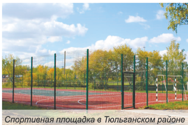
Спортивная площадка в Тюльганском районе

Новый федеральный закон закрепил простые и понятные правила взаимодействия жителей с властью для решения задач на местном уровне. Другими словами, дал людям возможность определять, на реализацию каких проектов направлять бюджетные средства. Прописан в законе — почти пошагово — и сам механизм принятия решений.