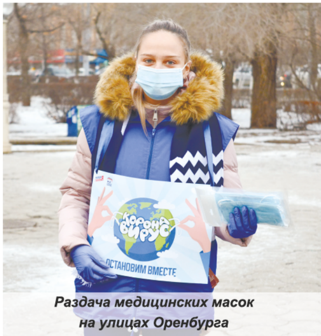
Раздача медицинских масок на улицах Оренбурга

«Важно не растратить то, что удалось сделать за последнее время, сохранить людей. Они не начитались программ партии и решили сделать политическую карьеру, а реально пришли помогать. Это самый высший политический капитал, который можно было накопить за период пандемии», – подчеркнул ранее Председатель партии Дмитрий Медведев.